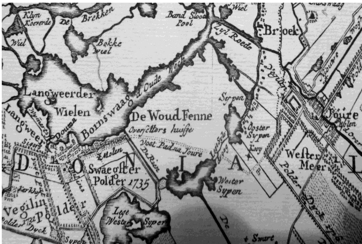
Vegelinkaart 1739, met daarop het voetpad na Joure

Op dit moment wordt er gewerkt aan een inventarisatie van dijken in Friesland. Dit wordt gedaan omdat de kennis over de vroegere waterstaatswerken onvoldoende bekend is. Dat merken wij ook als we in gesprek raken over de waarde van de Omkromte. Het zal u dan ook niet verbazen dat juist de Omkromte weer prominent zichtbaar wordt gemaakt in deze dijkeninventarisatie.